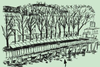
LE MÉMORIAL DE L'ABOLITION DE L'ESCLAVAGE, SUR LE QUAI, 2000 PLAQUES COMMEMORATIVES MENTIONNANT LE NOM DES NAVIRES NÉGRIERS ET LES EXPÉDITIONS. SOUS LE QUAI, INACCESSIBLE ACTUELLEMENT À CAUSE DES INONDATIONS, UN PARADISE ÉVOQUE LES CANES DANS LESQUELS ÉTAIENT ENVAHISSES LES AFRICAINS.